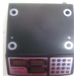
4 arruelas na parte superior