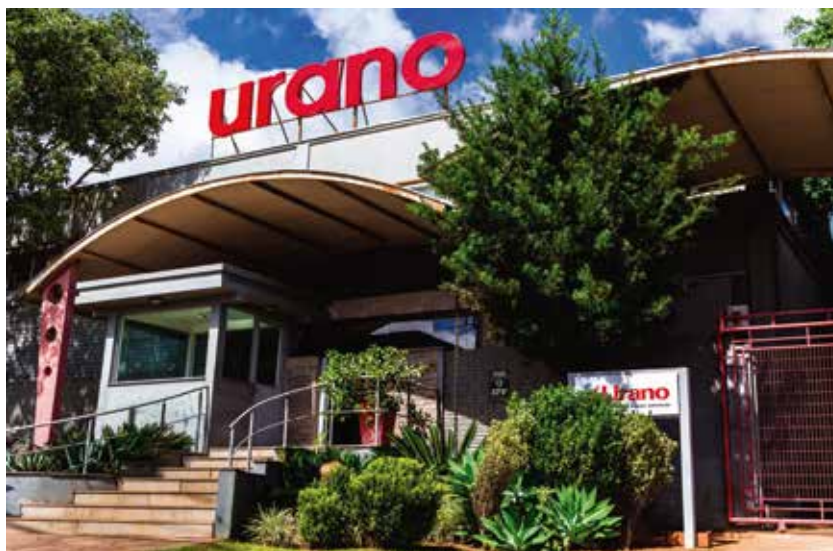
Fachada da MATRIZ em Canoas (RS)

Visite nosso site, www.urano.com.br , ou fale conosco pelo e-mail: vendas@urano.com.br . Impulsione seu negócio com as soluções completas da Urano!