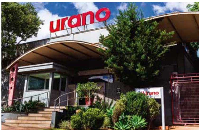
Fachada da MATRIZ em Canoas (RS)

Visite nosso site, www.urano.com.br , ou fale conosco pelo e-mail: vendas@urano.com.br . Impulsione seu negócio com as soluções completas da Urano!